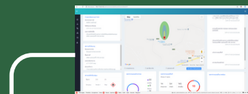
ZERO LOSS Cloud Service