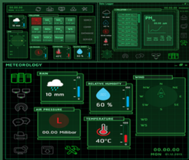
Graphic Dashboard Custom Graphic Dashboard เป็น Options เสริม สามารถสั่งซื้อเพิ่มเติมได้

Data Monitoring Dashboard นำเสนอข้อมูลในรูปแบบ กราฟ ตาราง หรือมุมมองgraphic dashboard ที่ต้องการ