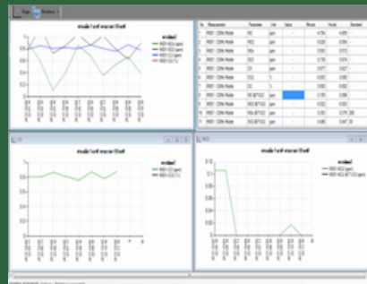
Table Dashboard (Basic)